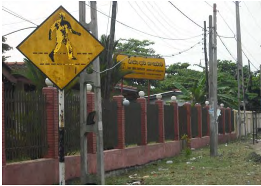
කාර්ය සාධන හා පරිසර විගණන ඒකකය