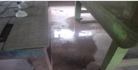
මාකොළ සහතික කළ පාසලේ විදුලි අංශය

මෙම පාසලේ විදුලි අංශයේ සම්පත් පරීක්ෂා කිරීමේ දී පහත කරුණු අනාවරණය විය. ගුරුවරයාගේ හා ළමුන්ගේ ක්‍රියාශ්‍රීලි සහභාගීත්වය සහිතව මෙම සහතික පාසලේ විදුලි අංශය පවත්වාගෙන යමින් තිබුණද, පාඨමාලා සඳහා අවශ්‍ය ගුණාත්මක බවින් යුතු ද්‍රව්‍ය නියමිත වේලාවට ලබාදී නොතිබූ අතර මෙහි වහලයෙන් ද වර්ෂා කාලයේ දී වැසි ජලය කාන්දුවන බව නිරීක්ෂණය විය.