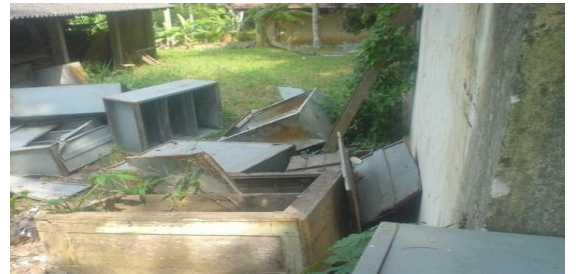
රන්මුතුගල රැදවුම් නිවාසයේ කැඩුණු ලී බඩු