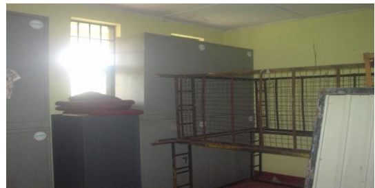
මුල්ගුරු නිල නිවාසයේ භාවිතා නොකළ අල්මාරි

(ඊ) මාකොළ සහතික කළ පාසලේ මුල්ගුරු නිල නිවාසයේ කාමර දෙකක කැඩුණු පරිගණක, කැඩුණු ඇඳුන් හා රාක්ක ගබඩා කර තිබුණු අතර නිල නිවාසයේ ආලින්දයේ අලුත් වානේ අල්මාරි 3ක් භාවිතා කිරීමෙන් තොරව ගබඩා කර තිබුණි.