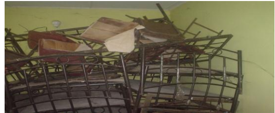
මුල්ගුරු නිල නිවාසයේ භාවිතා නොකළ ලීබඩු ගබඩා කිරීම.