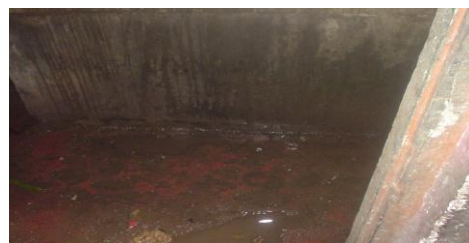
රන්මුතුගල සහතික කළ පාසලේ