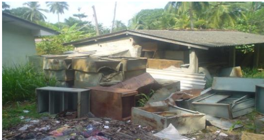
රන්මුතුගල රැදවුම් නිවාසයේ කැඩුණු ලී බඩු