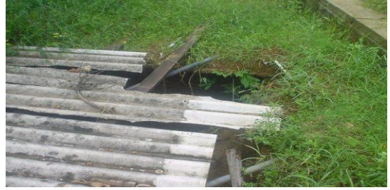
මාකොල සහතික කළ පාසලේ ආවරණය නොකෙරුණු වැසිකිළි වළ