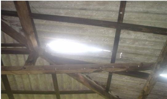
මාකොළ සහතික කළ පාසලේ පෙදරේරු අංශයේ කැඩුණු වහලය

(iii) මෙම පාසැලේ පෙදරේරු අංශයේ සහ විදුලි අංශයේ වහලයෙන් වැසි ජලය කාන්දුවන බැවින් පාඨමාලා පැවැත්වීමට මූලික පහසුකම් නොමැති තත්ත්වයක් පැවතුණි.