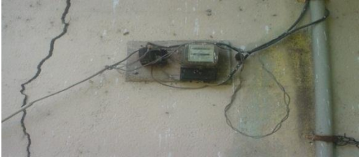
රන්මුතුගල රැදවුම් නිවාසයේ අනාරක්ෂිත විදුලි පද්ධතිය.

මෙම නිවාසයේ විදුලි පද්ධතිය හා ගොඩනැගිලි වල ඇතැම් ස්ථාන ඉතා අනාරක්ෂිත ඒවා බව නිරීක්ෂණය විය.