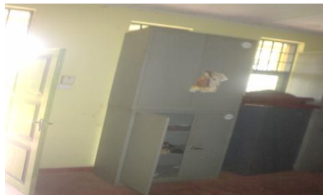
මුල්ගුරු නිල නිවාසයේ භාවිතා නොකළ අල්මාරි