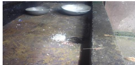
මාකොළ සහතික කළ පාසලේ අපිරිසිදු