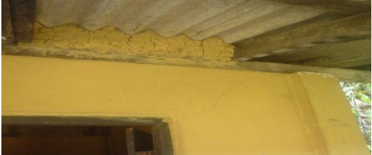
රන්මුතුගල රැදවුම් නිවාසයේ කෘමියන්ගෙන් අනාරක්ෂිත වූ ආහාර ගබඩාව.