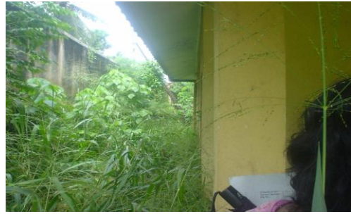
මුල්ගුරු නිල නිවාසය අවට පිරිසිදු කර