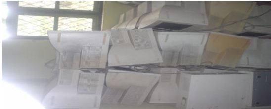
මුල්ගුරු නිල නිවාසයේ භාවිතා නොකළ ලී බඩු ගබඩා කර තිබීම.

(ඉ) මාකොළ සහතික කළ පාසලේ මුල්ගුරු නිල නිවාසය එය නිම කළ දිනය සිට භාවිතා නොකර ගබඩාවක් ලෙස යොදාගෙන තිබුණි.