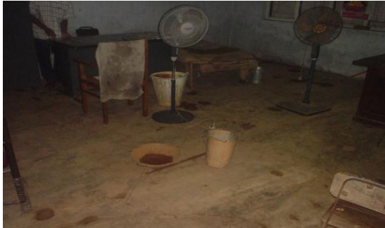
මාකොළ සහතික කළ පාසලේ අපිලිවෙළට දර්ශනය වූ පෙදරේරු අංශය

මෙම පාසලේ විදුලි අංශයේ සම්පත් පරීක්ෂා කිරීමේ දී පහත කරුණු අනාවරණය විය. ගුරුවරයාගේ හා ළමුන්ගේ ක්‍රියාශ්‍රීලි සහභාගීත්වය සහිතව මෙම සහතික පාසලේ විදුලි අංශය පවත්වාගෙන යමින් තිබුණද, පාඨමාලා සඳහා අවශ්‍ය ගුණාත්මක බවින් යුතු ද්‍රව්‍ය නියමිත වේලාවට ලබාදී නොතිබූ අතර මෙහි වහලයෙන් ද වර්ෂා කාලයේ දී වැසි ජලය කාන්දුවන බව නිරීක්ෂණය විය.