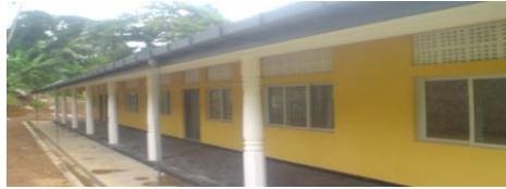
භාවිතා නොකළ ගිලන් කාමරය

(ඇ) අසනීප ළමුන් බලා ගැනීම සඳහා වෙනම කාර්ය මණ්ඩලයක් නොවූ බැවින් මාකොළ සහතික කළ පාසලේ ගිලන් කාමරය නිමකළ දින සිට භාවිතයට ගෙන නොතිබුණි.