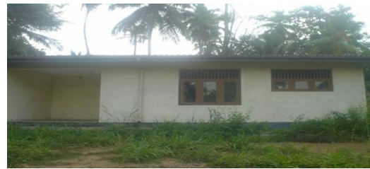
භාවිතා නොකළ තනිකඩ නිල නිවාසය