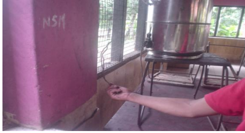
මාකොල සහතික කළ පාසලේ අනාරක්ෂිත විදුලි පද්ධතිය