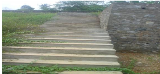
ගිලන් හලට යෑමට ඇති පියගැටපෙල

(ඌ) රෝගී වූ ළමුන් රඳවන ගොඩනැගිල්ල පොළව මට්ටමට වඩා පහතින් නිමවා තිබූ අතර පඩි 25ක් පහළට බැසීමට සිදුවීම නිසා අසනීප ළමුන් එහාමෙහා ගෙනයාම හා ප්‍රවාහන පහසුකම් වලදීද අපහසුතාවට පත්වීම.