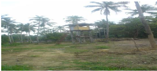
භාවිතා නොකළ මුරකරු කාමරය