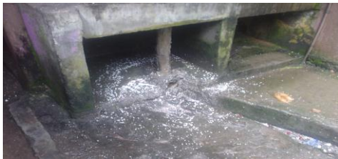
මාකොළ සහතික කළ පාසලේ අපිරිසිදු

(අ) රන්මුතුගල හා මාකොළ රැදවුම් නිවාසවල මුළුතැන්ගෙය හා ප්‍රජාපති ළමුන් භාරගැනීමේ නිවාසයේ මුළුතැන්ගෙය විගණන දිනයේ දී පිරිසිදු තත්ත්වයෙන් තිබුණු නමුත්, රන්මුතුගල හා මාකොළ සහතික කළ පැසල්වල මුළුතැන්ගෙවල් ඉතා අපිරිසිදු තත්ත්වයෙන් පැවතුණි. (අපිරිසිදු හා ආහාර කොටස් බිම තැන තැන විසිරී තිබුණු අතර මැස්සන්ද බහුල විය.) කාණු පද්ධතිය අපිරිසිදු වී ගොඩනැගිලි වල ජනෙල් කැඩී තිබුණි.