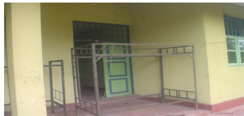
භාවිතා නොකළ මුල්ගුරු නිල නිවාසය

(ආ) රන්මුතුගල සහතික කළ පාසැලේ තනිකඩ නිල නිවාසවල ජනෙල් පියන් කිසිවෙකු විසින් කඩා තිබුණු බවත් ගොඩනැගිල්ල අවට ප්‍රදේශය තණකොළ වැවී තිබුණු බවත් නිරීක්ෂණය විය.