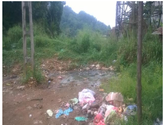
තල්දූව සති පොළ