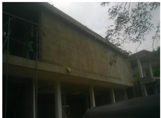
වාරි ඇළ හරස්කල ඉදිකර ඇති කඩසාප්පු